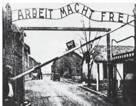
Az auschwitzi koncentrációs tábor bejárata