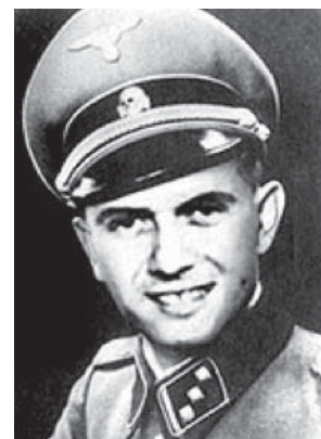
Dr. Josef Mengele